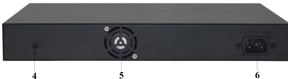
Рисунок 2 - Задняя панель коммутатора.